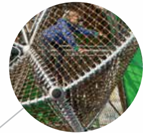
Außenliegender Verbindungstunnel über mehrere Ebenen.