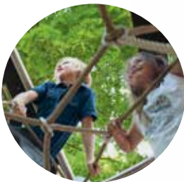
Die Etagen sind durch ein Raumnetz miteinander verbunden.