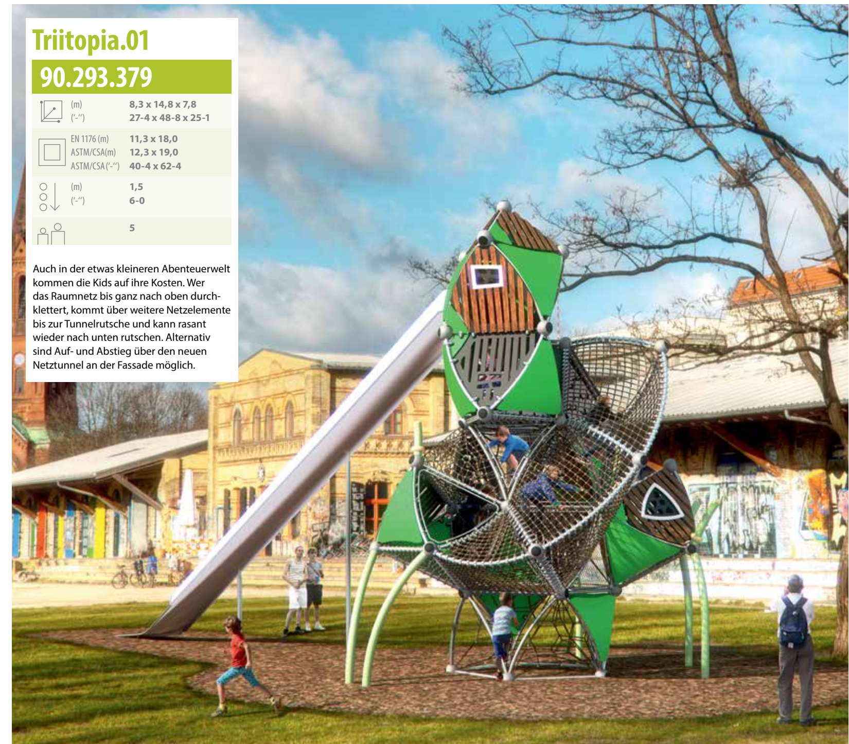
Berliner Greenville Triitopia

Auch in der etwas kleineren Abenteuerwelt kommen die Kids auf ihre Kosten. Wer das Raumnetz bis ganz nach oben durchklettert, kommt über weitere Netzelemente bis zur Tunnelrutsche und kann rasant wieder nach unten rutschen. Alternativ sind Auf- und Abstieg über den neuen Netz-tunnel an der Fassade möglich.