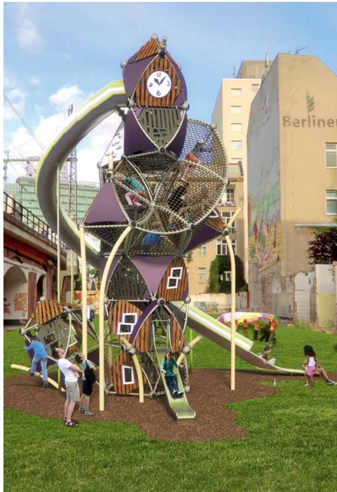
Berliner Greenville Triitopia

Mit einer Höhe von über zehn Metern und einem riesigen Raumnetz im Innern bietet dieser Kletter- und Spielturm auf sieben Etagen unbegrenzte Möglichkeiten für Spaß und Abenteuer.