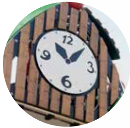
Individuelle Motivgestaltung möglich.