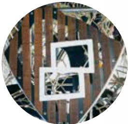
Total verdreht: Fassadenelemente überkopf.