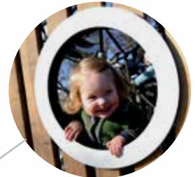
Fenster und Durchstiege in unterschiedlichem Design.